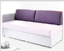
Rückenkissen 100 cm

10% Aufpreis für Sondergröße: 80x200 cm, 80x190 cm und 90x190 cm