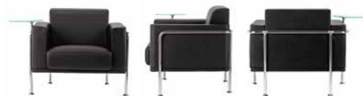
MA11L + MTRCC